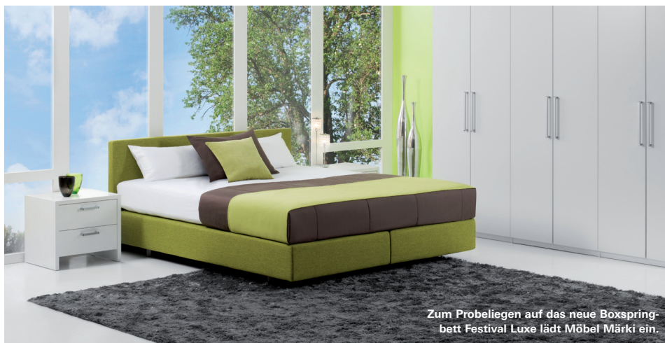
Zum Probeliegen auf das neue Boxspringbett Festival Luxe lädt Möbel Märki ein.

Riedstrasse 1 im Pestalozzi-Haus 8953 Dietikon www.moebelmaerki.ch